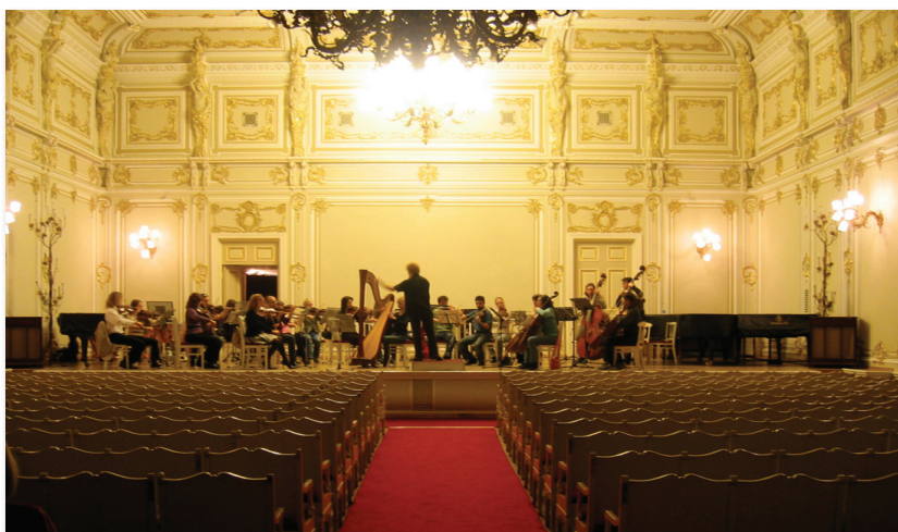
Репетиция СПбКФ в Малом зале им. Глинки

«Посланники доброй воли посредством музыки»