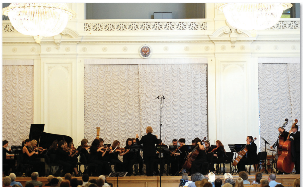
СПбКФ в Белом зале Санкт-Петербургского государственного политехнического университета

Белый зал Санкт-Петербургского государственного политехнического университета